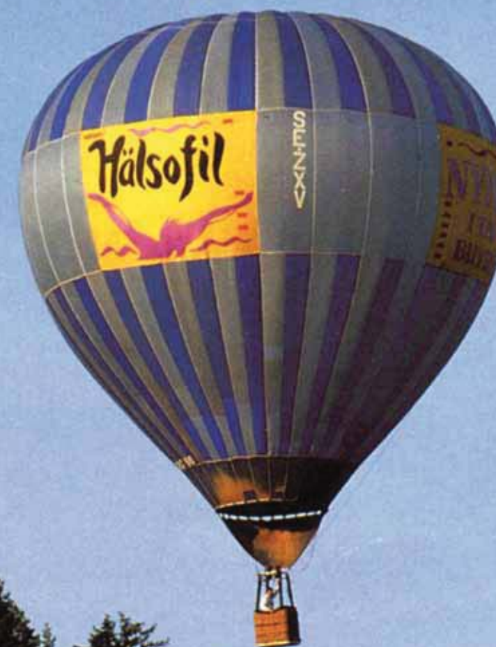
Verum når nya höjder, 1992.

heten – i stort sett allt är förändrat. Att mejeriföretaget skulle vara särskilt affärsdrivande var inte aktuellt förr. Ta bara en sådan sak som att vd inte fanns med i styrelsen där de stora och avgörande besluten alltid fattas (i Norrmejerier kom vd med 1973). Tjänstemännens huvudsakliga uppgift var administration och att förhandla med regering, riksdag och intresseorganisationer för att få till så bra subventioner, priser och kvoter som möjligt. Allt reglerades centralt.