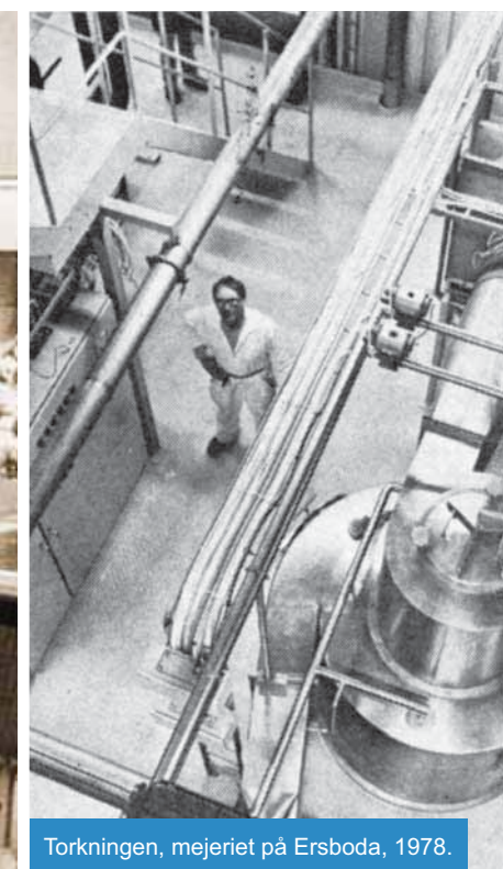
Torkningen, mejeriet på Ersboda, 1978.

Många viktiga händelser och anekdoter hittar du i tidslinjen längst ned på sidorna i det här reportaget. Att grotta in sig i Norrmejeriers historia från 1971 och tidigare än så, är också att blicka tillbaka på ett svunnet Norrland då kor, gödseldoft, långfil och grusvägar med mjölkpallar var en helt naturlig del av livet för de flesta.