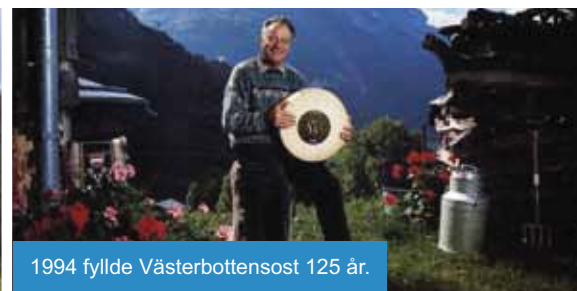
1994 fyllde Västerbottensost 125 år.