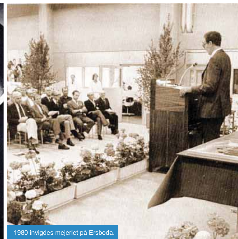
1980 invigdes mejeriet på Ersboda.