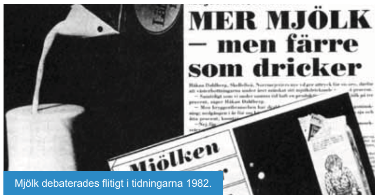
Mjök debaterades flitigt i tidningarna 1982.