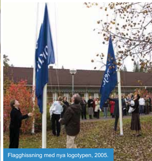
Flagghissning med nya logotypen, 2005.

– Vi kompletterade varandra mycket bra. I Luleå hade vi stor volym på mjölkproduktionen, 80% gick till den ekonomiskt starka färskmjölksförsäljningen, samtidigt som Västerbotten hade mycket bra specialkompetens. Kemin stämde och tillsammans blev vi starkare, fast det är klart att det