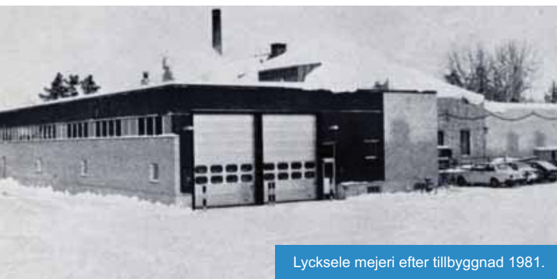
Lycksele mejeri efter tillbyggnad 1981.